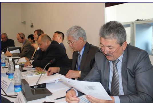
Участники конференции ознакамливаются с представленными данными.

Организация, выполняющая проект: Фонд Евразия Центральной Азии