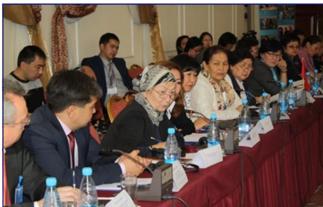
Во время обсуждения завязалась бурная дискуссия.

При поддержке USAID и MOM 3 ноября Правительство Кыргызской Республики организовало Диалог по исполнению закона о предотвращении и борьбе с торговлей людьми. Эта многодисциплинарная дискуссия позволила выявить недостатки в исполнении закона и привлекла внимание Жогорку Кенеша к