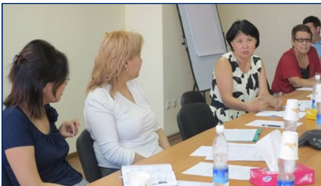
Сотрудники Министерства социального развития обсуждают стратегический план.

USAID продолжает оказывать поддержку Министерству социального развития во внедрении новых решений в работу головного офиса министерства. Методики были предложены, основываясь на анализе внутренних процедур и рабочего процесса министерства. Среди предложенных решений системы по совершенствованию управления персоналом, информационные технологии и системы мониторинга и оценки. Министерство разработало стратегический план по внедрению этих рекомендаций. В начале декабря Министерство при поддержке USAID запустило пилот по применению новой информационной технологии. Специалисты по управлению персоналом министерства также начали пересматривать должностные обязанности всех сотрудников и отделов и разрабатывать ключевые индикаторы эффективности для всего головного отдела министерства.