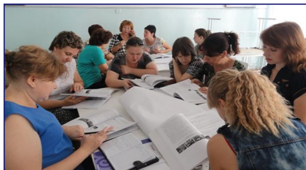
Учителя знакомятся с новыми методами преподавания чтения.

Проект USAID «Читаем вместе» оказывает поддержку Министерству образования в улучшении навыков чтения и понимания прочитанного среди учеников начальной школы. Проект работает с институтами повышения квалификации учителей, школами и местными сообществами, а также с частным сектором. На начало года проект запустил курс обучения в 600 школах, охватив почти 3 000 учителей начальных классов, которые вместе обучают свыше 143 000 учеников по всей республике. Зимой и весной 2015 года проектом будет охвачено около 7 500 учителей, которые обучают 60 процентов учеников младших классов страны. EGRA, разработанная в сотрудничестве с Национальным центром тестирования и Министерством образования и науки Кыргызской Республики, будет служить отправным пунктом проекта. Оценка будет проводится регулярно для того, чтобы отслеживать результативность проекта.