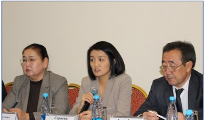
Круглый стол по социальному заказу. На открытии: Вице-премьер-министр по социальным вопросам Э. Сариева, Вице-мер г. Бишкек А. Рыскулова и Министр социального развития К. Базарбаев.

Более подробная информация по этой ссылке .