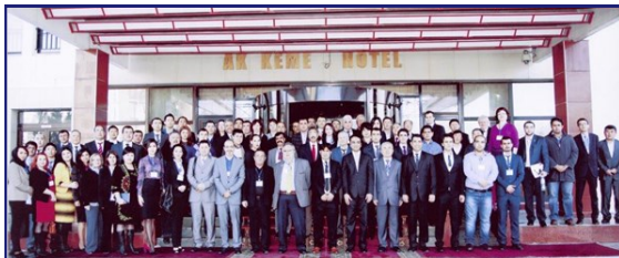
Участники семинара.

18-20 декабря Проект USAID по торговле и доходам организовал в Бишкеке региональный семинар по логистике и транспорту, на который приехали представители различных государственных ведомств и частного сектора, включая, перевозчиков, грузовых операторов, экспедиторские компании, компании предоставляющие логистические и складские услуги из Афганистана, Индии, Казахстана, Кыргызстана, Пакистана, Таджикистана, Туркменистана и Узбекистана. Свыше 90 участников семинара обсудили текущие вопросы и возможности связанные с перевозками и складированием товаров в масштабах Центральной и Южной Азии, в том числе развитие и применение системы Международных дорожных перевозок (МДП) и повышение улучшение стандартов и условий для торговли. Семинар был организован в партнёрстве с Федерацией Ассоциаций Перевозчиков и Экспедиторов стран участников ЦАРЕС, ОБСЕ и Ассоциацией международных автомобильных перевозчиков Кыргызской Республики (АМАП-КР). В рамках деятельности Проекта ATAR USAID предоставляет техническую помощь Таможенной Службе Кыргызской Республики, Министерству Экономики, бизнес ассоциациям, союзам перевозчиков, таможенным брокерам и другим представителям частного сектора. ATAR поддерживает инициативы направленные на реформы, способствующие повышению регионального сотрудничества.