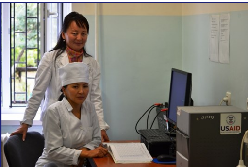
Сотрудники Центра семейной медицины в г. Иссык-Ата, работающие с оборудованием GeneXpert®.

Организация, выполняющая проект: Abt Associates