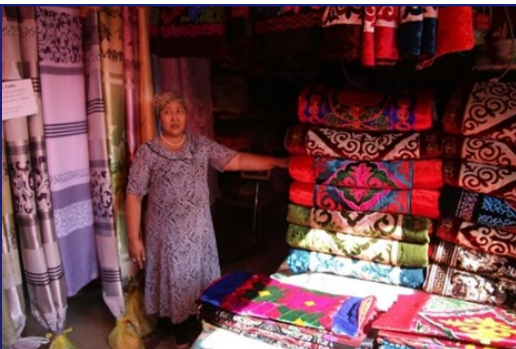
Частный предприниматель на юге республики, который получил поддержку от Гарантийного Фонда, созданного при поддержке USAID.

31 декабря USAID подписал с банками Демир и Бай Тушум соглашение о гарантировании займов для того, чтобы стимулировать выдачу займов местным предпринимателям. При помощи механизма USAID Кредитование развития, который использует прием разделения риска для того, чтобы мобилизовать местный капитал, USAID гарантирует выплату 50% кредитов, выданных предприятиям малого бизнеса в сфере туризма, текстильной промышленности и сельском хозяйстве, которые предоставляют