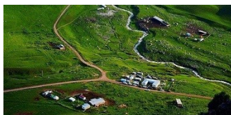
Ущелье Чункурчак @bosyakgz

В рамках подготовки к юбилею ЕБРР и 25-й ежегодной встрече акционеров ЕБРР, мы попросили наших подписчиков в социальных сетях внести свой вклад и прислать фотографии своих стран, которые иллюстрируют красоту и разнообразие стран, где мы работаем. Несколько сотен приняли вызов. Взгляните на некоторые фотографии из Кыргызстана, которые вы нам прислали. Вот почему Кыргызская Республика #EBRDcountry особенная!