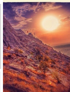
Восход в Оше @bosyakgz