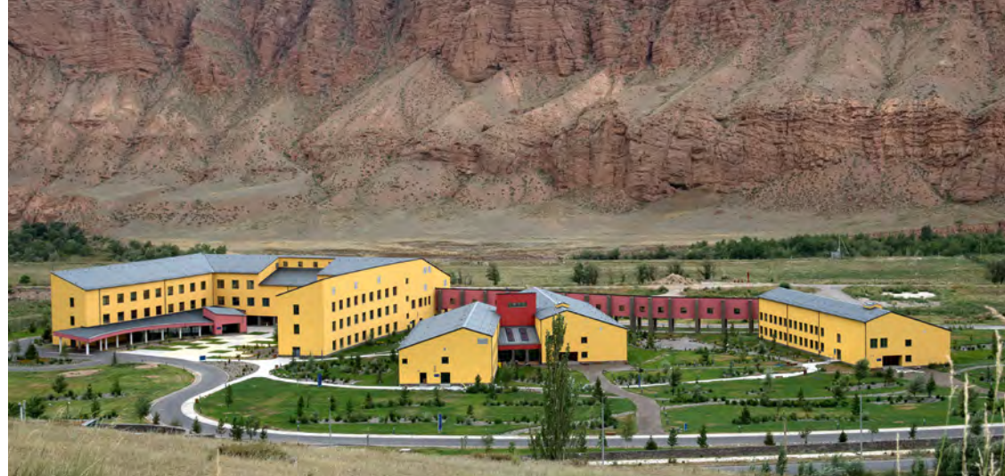
Университет Центральной Азии (УЦА), кампус в г. Нарын