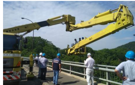
Обследование существующего моста с применением специализированной техники.

МТиД, куда были приглашены все организации, заинтересованные в мостостроении. Во время презентации были озвучены такие идеи как создание рабочей группы для внесения закона об обязательной инспекции мостов, разработка плана реализации курсов повышения квалификации инженеров мостовиков на базе университета. Таким образом, из трех планируемых тренингов по мостостроению был завершен первый и полученные знания будут использованы для распространения информации среди сотрудников дорожных организаций, а также продвижения японских технологий в проектировании, строительстве и техническом содержании мостов в Кыргызской Республике.