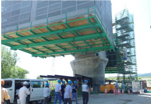
При возведении эстакады вблизи г. Фурано применяется метод навесного монтажа.

Первый тренинг по мостостроению был проведен с 22 июля по 11 августа 2018 года в Японии для сотрудников Министерства транспорта и дорог (МТиД), образовательного учреждения и проектного института Кыргызской Республики. В целях повышения потенциала проектирования, а также развития инженерных технологий мостов участники тренинга прослушали интересные лекции и посетили разнообразные участки. Тренинг был успешно завершен, и участники обучения поделились своими впечатлениями о поездке и планами на будущее на презентации 16 августа 2018 года в