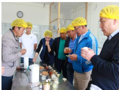
Представители Нарынской области.