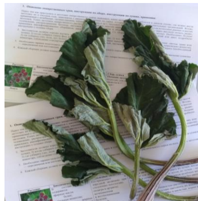
Лопух – лекарственная трава, произрастающая в КР.

Проект собрал информацию об отечественных фармацевтических компаниях, определил сорта, объемы и цены лекарственных трав, закупаемых ими на рынке, и подготовил обучающие материалы по сушке трав. Обучение проводилось по изучению свойств и характеристик лекарственных трав, мер безопасности и правильных сроков сбора медицинских трав, типов оборудования и методов сушки трав, требований стандартов ХАССП, правил хранения, транспортировки, маркировки