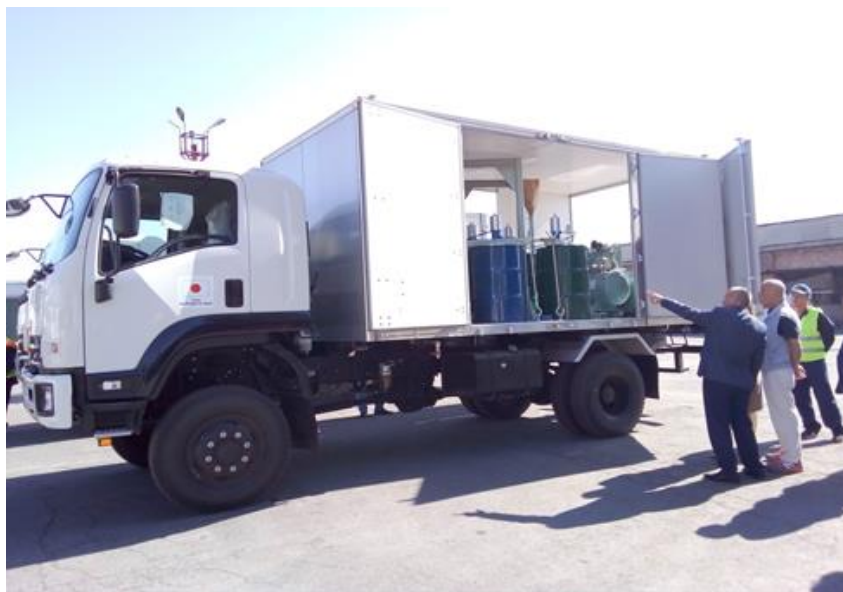
Помимо ремонтного оборудования каждая целевая мастерская будет снабжена топливозаправочной машиной.