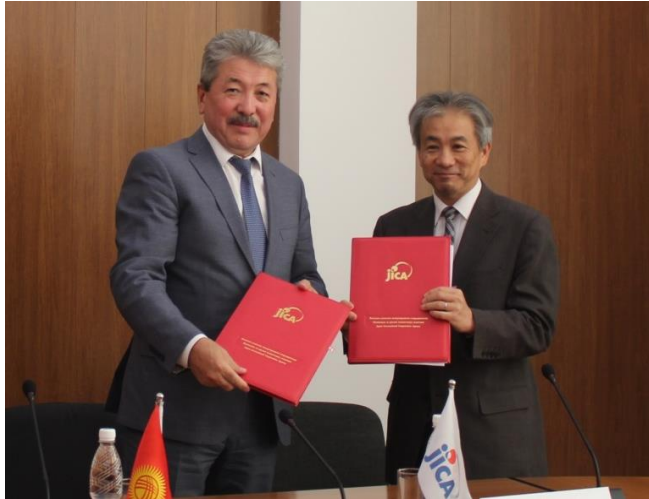
После подписания грантового соглашения по новой фазе JDS.

23 августа 2018 г. в Министерстве финансов Кыргызской Республики прошла церемония подписания обменных нот и грантового соглашения по «Проекту по предоставлению стипендии для развития человеческих ресурсов (JDS)». Сумма грантовой помощи от Правительства Японии Кыргызстану составила 308 миллионов японских йен (более 2,7 млн. долларов США). Правительство Японии,